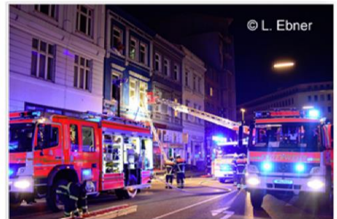
Die Feuerwehr Hamburg rettet bei einem Hotelbrand elf Personen über Steckleiter und Drehleiter aus dem Gebäude.

Am Mittwoch um 3.56 Uhr war die Berufsfeuerwehr Hamburg zu einem Feuer nahe des Hauptbahnhofs alarmiert worden. In einem Hotel waren Einrichtungsgegenstände und ein Elektroschrank in Brand geraten. Bei Eintreffen der Einsatzkräfte brannte es bereits im Erdgeschoss und ersten Obergeschoss des dreistöckigen Haus.