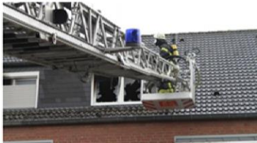
Bei einem Brand in einem Altenheim haben sich zwei Mitarbeiter des Hauses eine Rauchvergiftung zugezogen.

Letzte Aktualisierung: 6. Oktober 2016, 12:38 Uhr