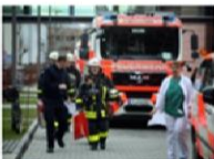
Feuerwehrlöcher beim Einsatz in der Uniklinik.

Drei Menschen erlitten bei einem Brand auf der Intensivstation des Frankfurter Uniklinikums Rauchvergiftungen. 50 Patienten mussten verlegt werden.